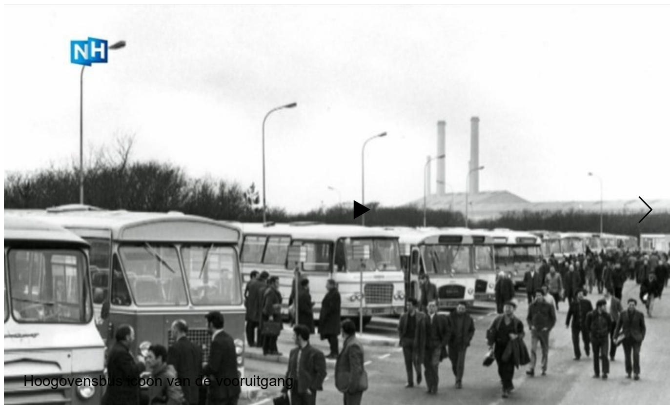
Hoogovensbus toon van de vooruitgang